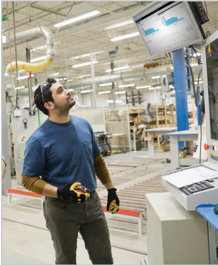
Ejemplo de uso de paneles internos públicos en piso de producción