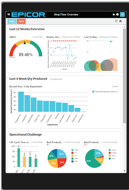
Tablero Ejecutivo en una tablet

por lo que nunca está desconectado de su información. “Siempre conectado” significa que puede responder rápidamente a las necesidades de su empresa y mantener su organización altamente productiva. Como un servicio basado en la nube, EDA minimiza los impactos del costo en el hardware y software de su sistema actual y los presupuestos de mantenimiento.